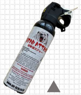
『熊撃退スプレー』 あまりにも高額で いちど購入を ためりました

春の山菜採りの中でも私が一番好きなのは、「ワラビ採り」です。生い茂った草の中からワラビを見つけた瞬間は、まるで宝探しのよう嬉しさがあり、夢中になる面白さがあります。今年も熊対策をしっかりと山へ出陣。今回は、お客さまから