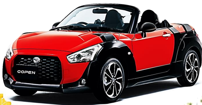
コペン エクスプレイ