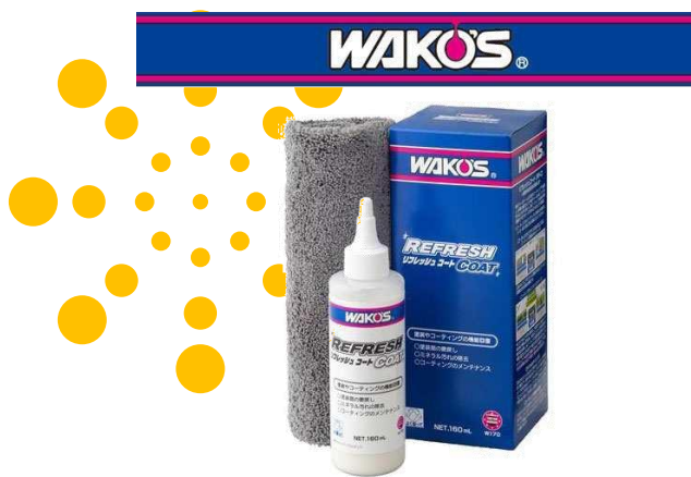
塗装やコーティングの機能回復剤