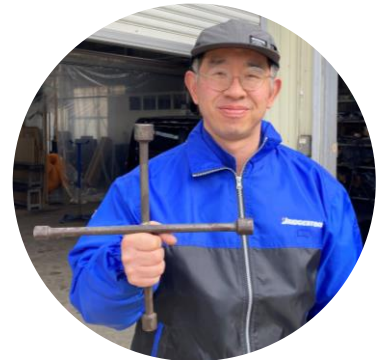
「ナットの締め付け順序」

空気圧の調整、ホイールナットの締め付けが心配な方は、当社まで気軽にご相談ください。サービスでチェックいたします！