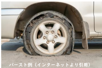
バースト例

タイヤの空気圧が低い状態で走行すると、タイヤの表面にたわみができてしまいます。これにより、タイヤと道路の設置面に異常負担がかかり、内部から破損しバースト(左の写真のような状態)してしまうのです。そのほか、燃費の低下、ハンドル操作や乗り心地の悪化など、空気圧が低い事はデメリットだらけ…。月1回の点検をオススメします！