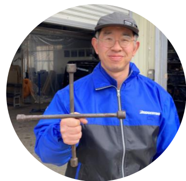
「ナットの締め付け順序」

空気圧の調整、ホイールナットの締め付けが心配な方は、当社まで気軽にご相談ください。サービスでチェックいたします！